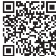
葛飾地区理大祭公式 Twitter